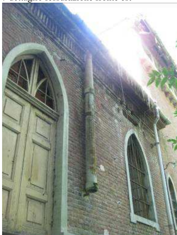
8 dettaglio tubo eternit fronte nord