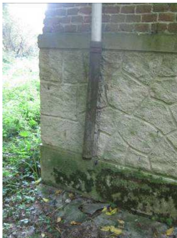
9 dettaglio gambale fronte nord