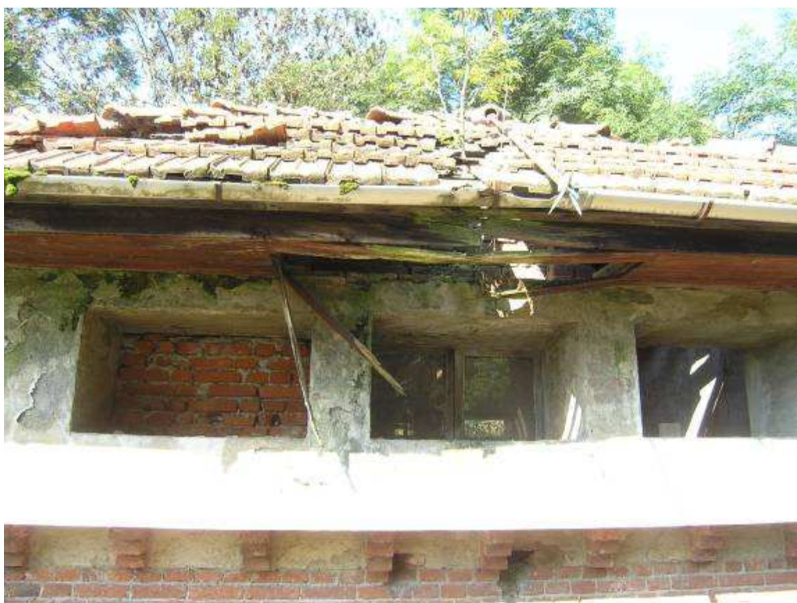
16 dettaglio tetto torre lato sud