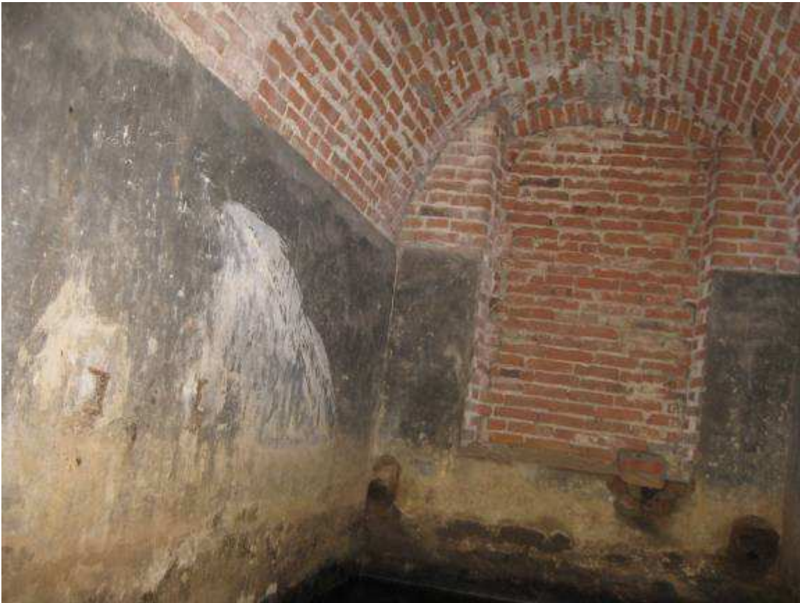
13 interno cisterna