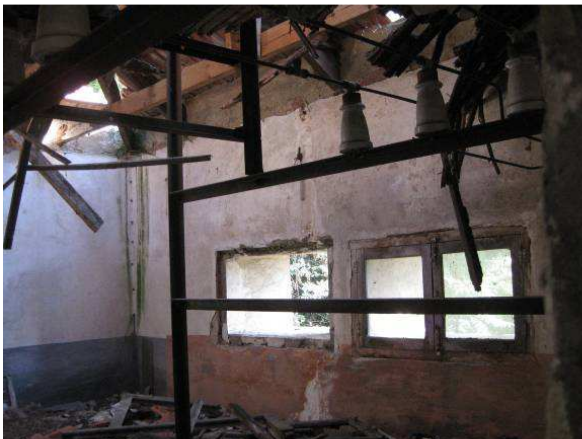
12 interno camera alta torre