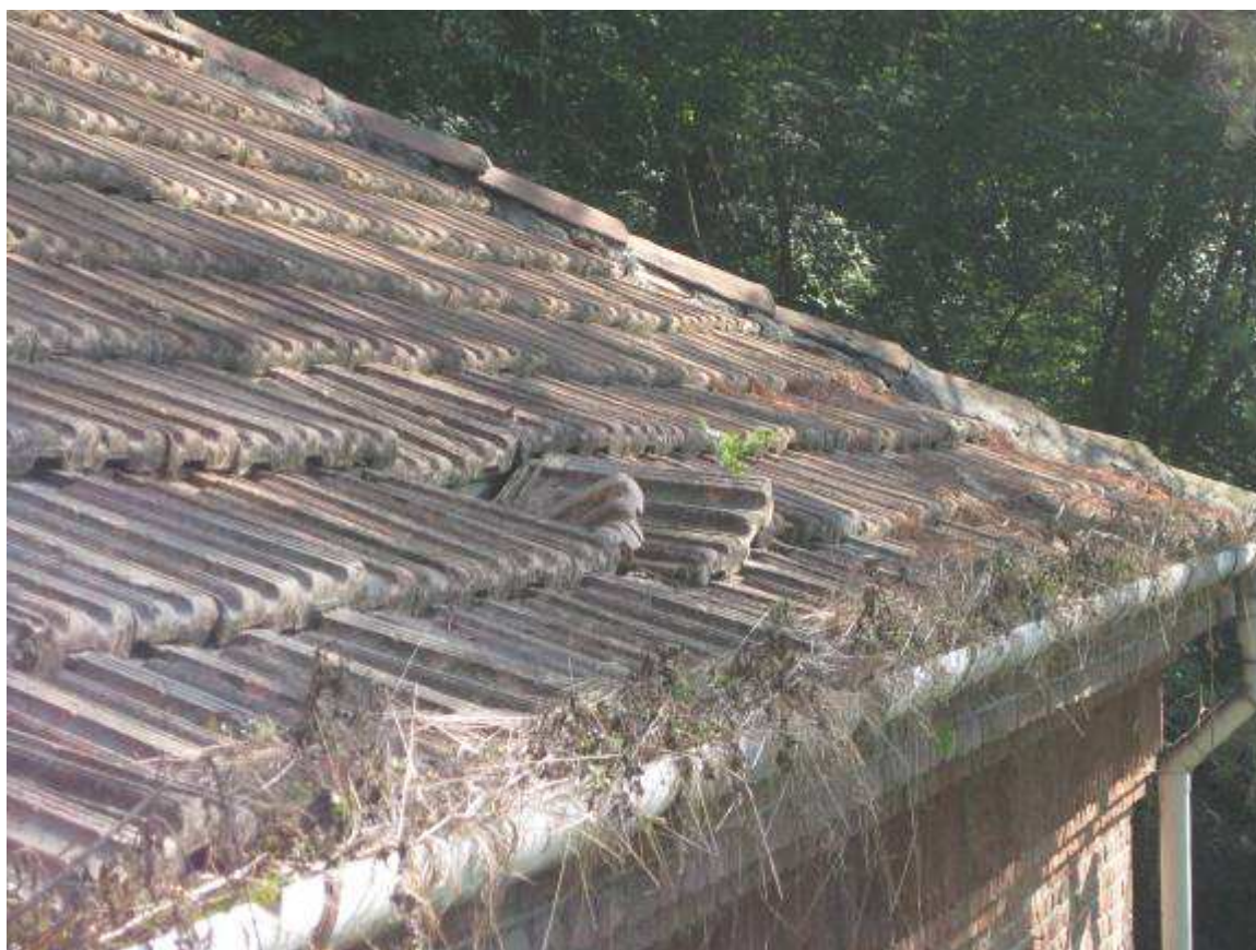
12 dettaglio tetto lato sud