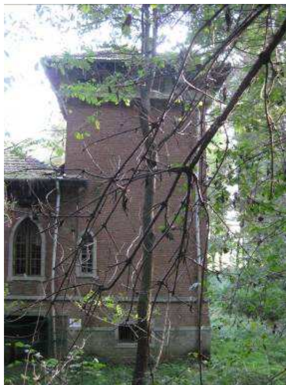
4 fronte nord