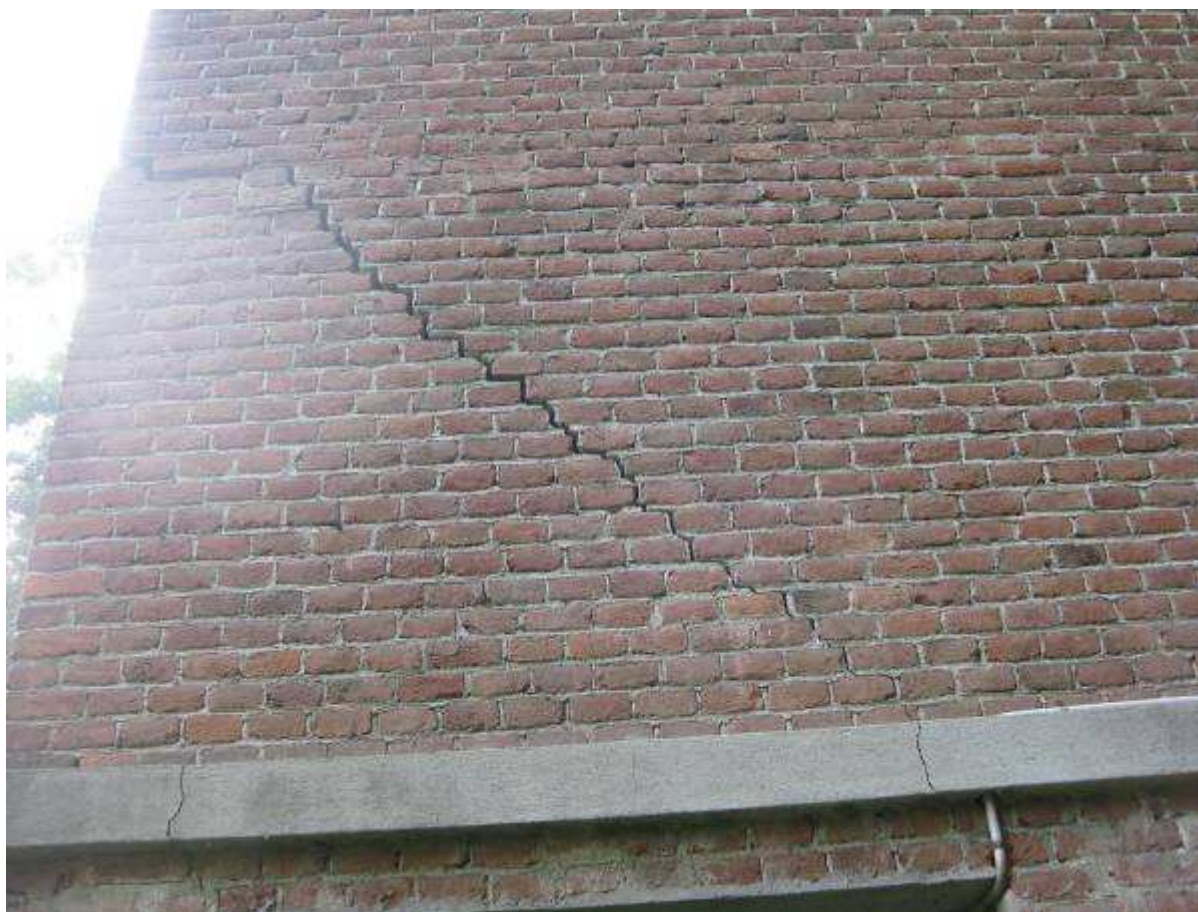
7 dettaglio fessurazione fronte est