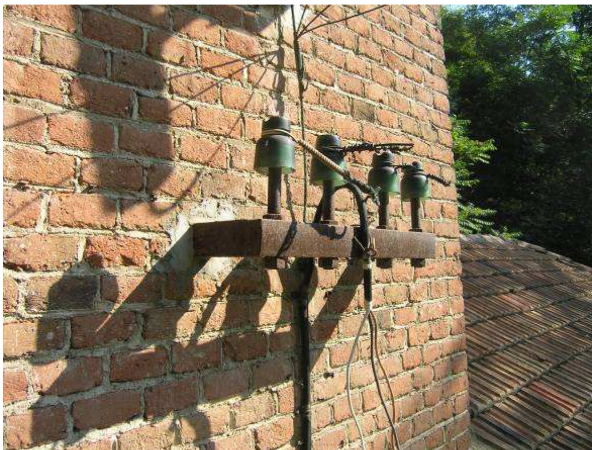
10 dettaglio isolatori fronte sud