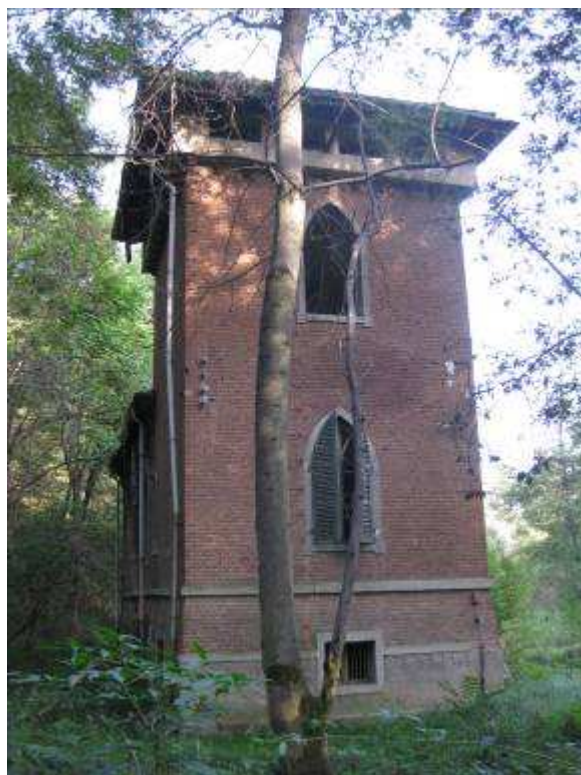
3 fronte ovest