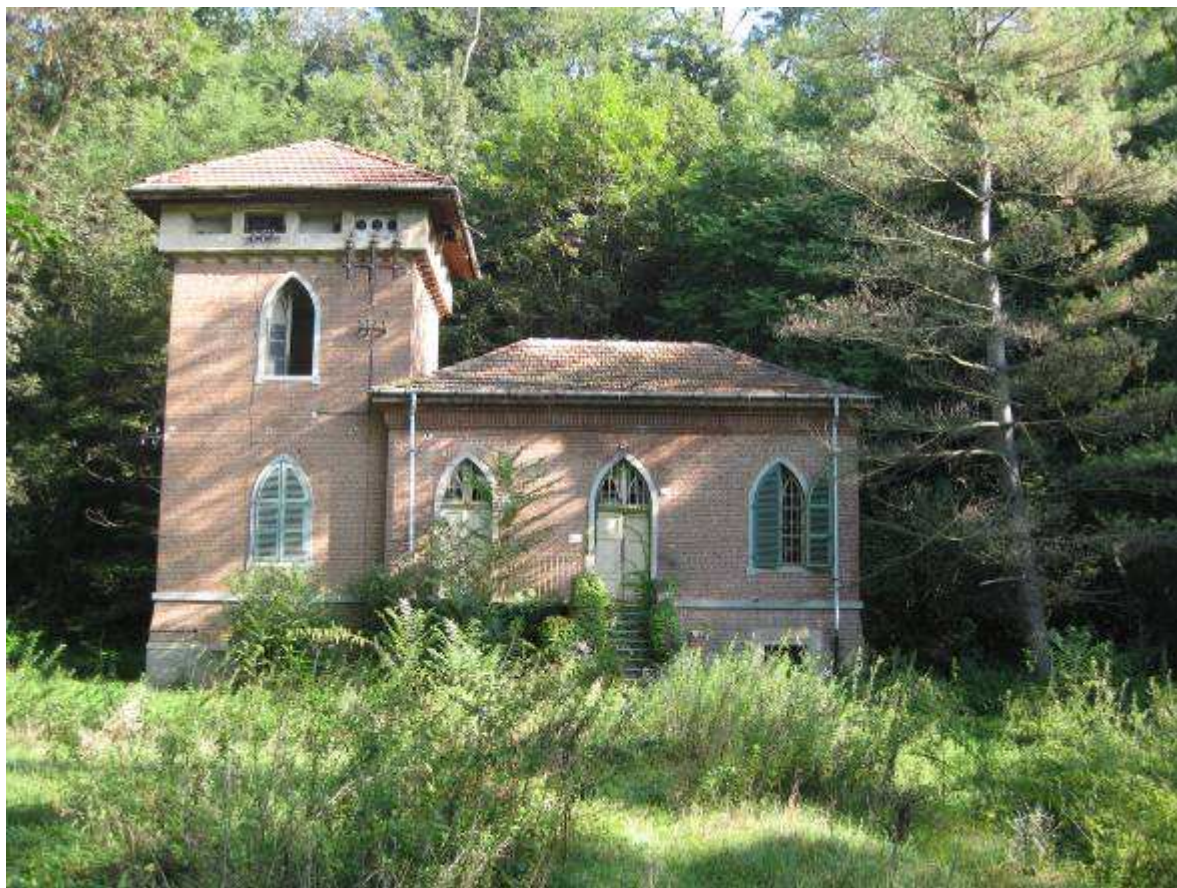
1 fronte sud