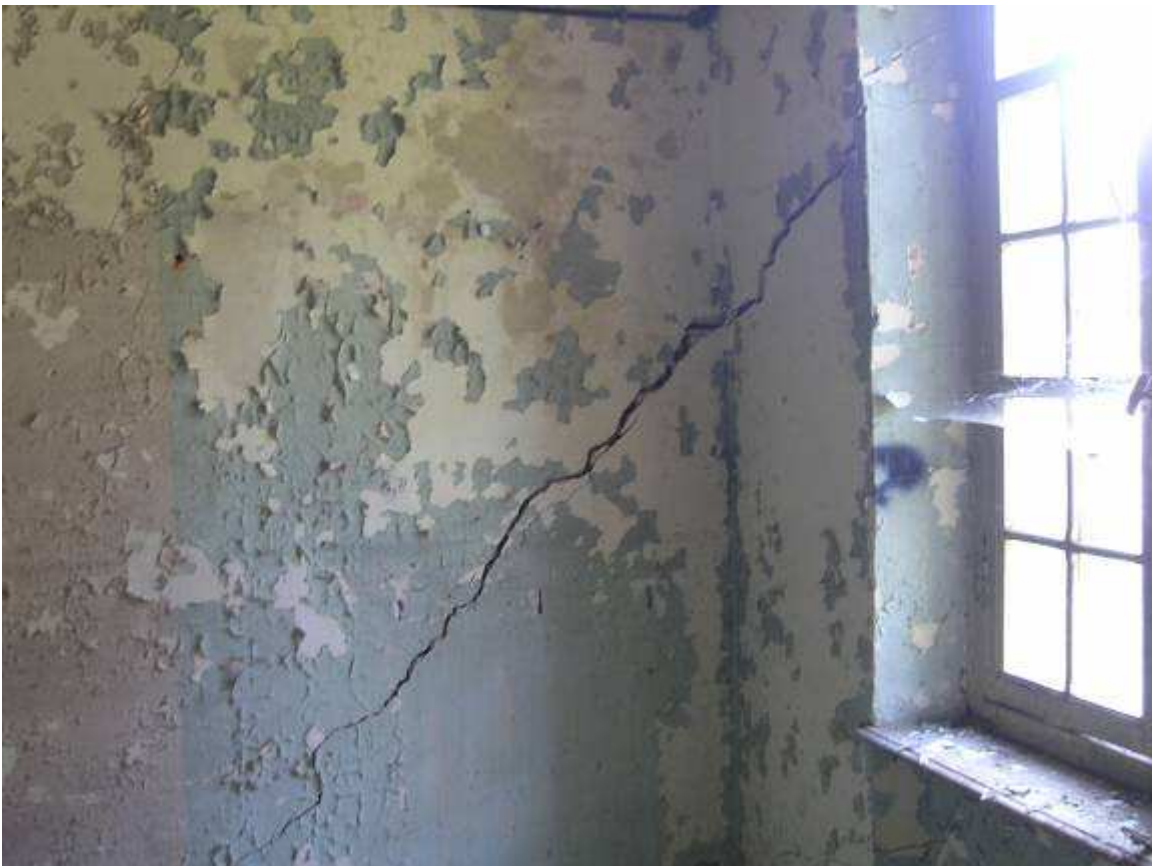
14 interno sala macchine, parete est