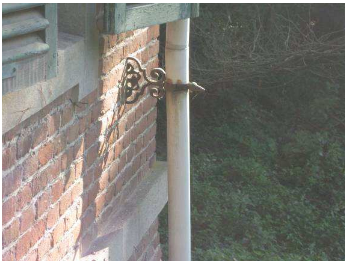
11 dettaglio porta gronda lato sud