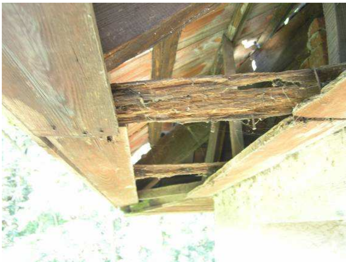
15 dettaglio cornicione torre lato sud